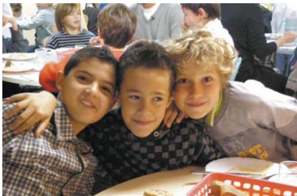
Repas indien dans les écoles grenobloises (semaine du goût 2007)