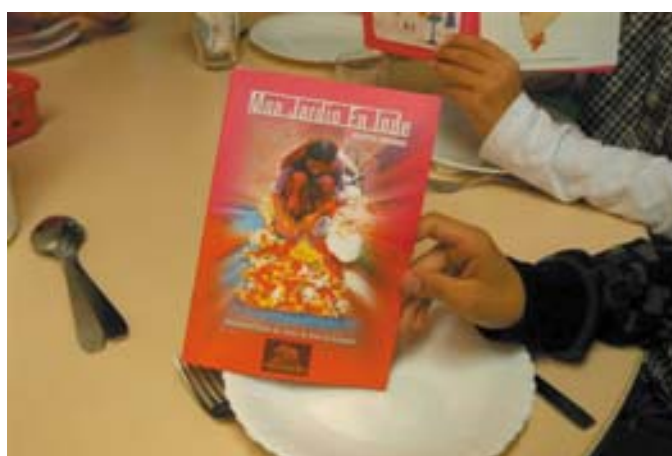
Le livret de recettes de cuisine franco- indienne " Mon jardin en Inde "