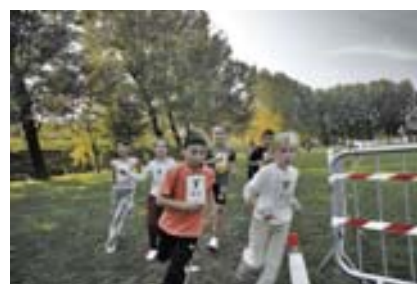
Le Coursethon des écoles de Saint-Martin le Vinoux (23 octobre 2007)